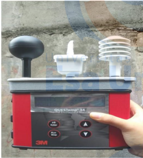
Alat Ukur WGBT