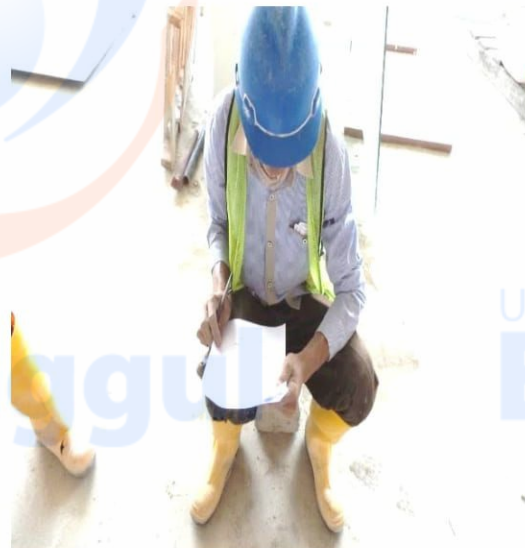
Responden pada Area Tw.3 Lt 14