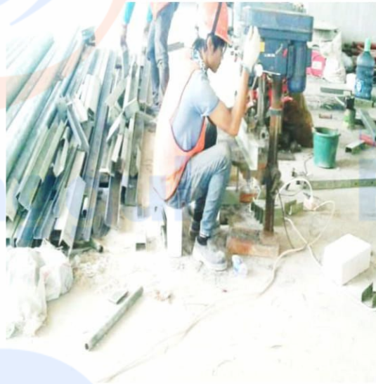
Pekerja Pada Area FB 3